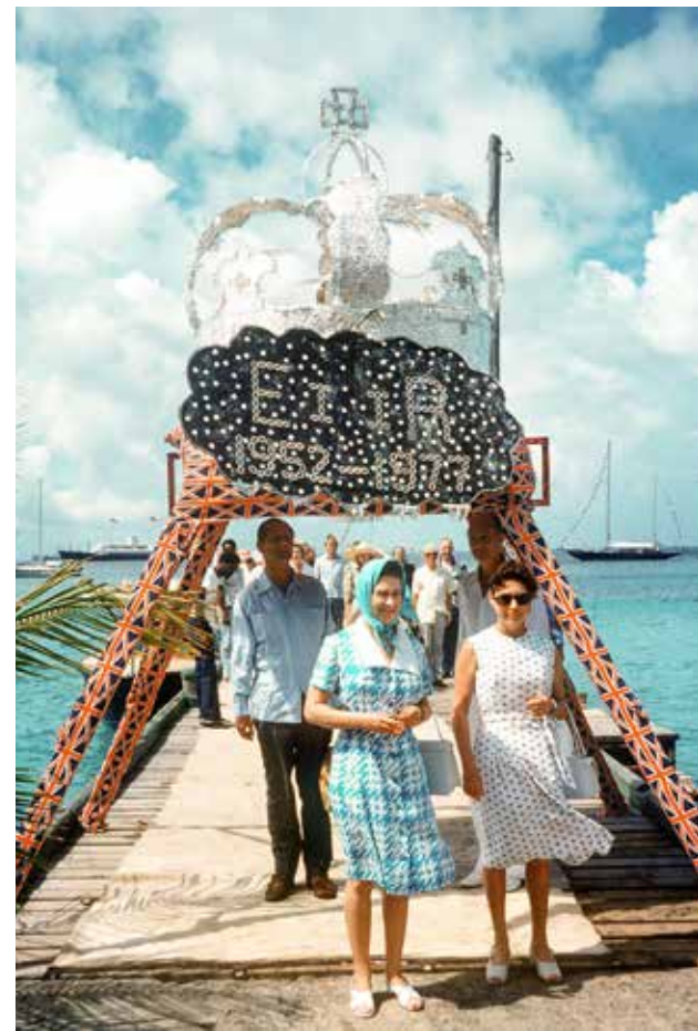
Royal 1977 besuchte die Queen ihre Schwester auf Mustique

In den verschiedenen Villen auf der Insel, die heute zum großen Teil vermietet werden, hängen noch immer die Partybilder von damals. Weiße Menschen in Kostümen, die heute nicht mehr