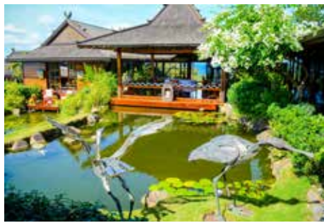
Stylish Hier urlaubte David Bowie in den 90er Jahren