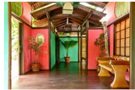
Farbenfroh Mick Jagger's Villa „Stargroves“ kann man mieten