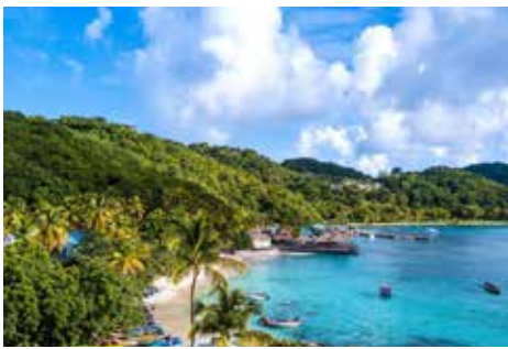
Idyllisch Blick auf „Basil's Bar“ an der Westküste