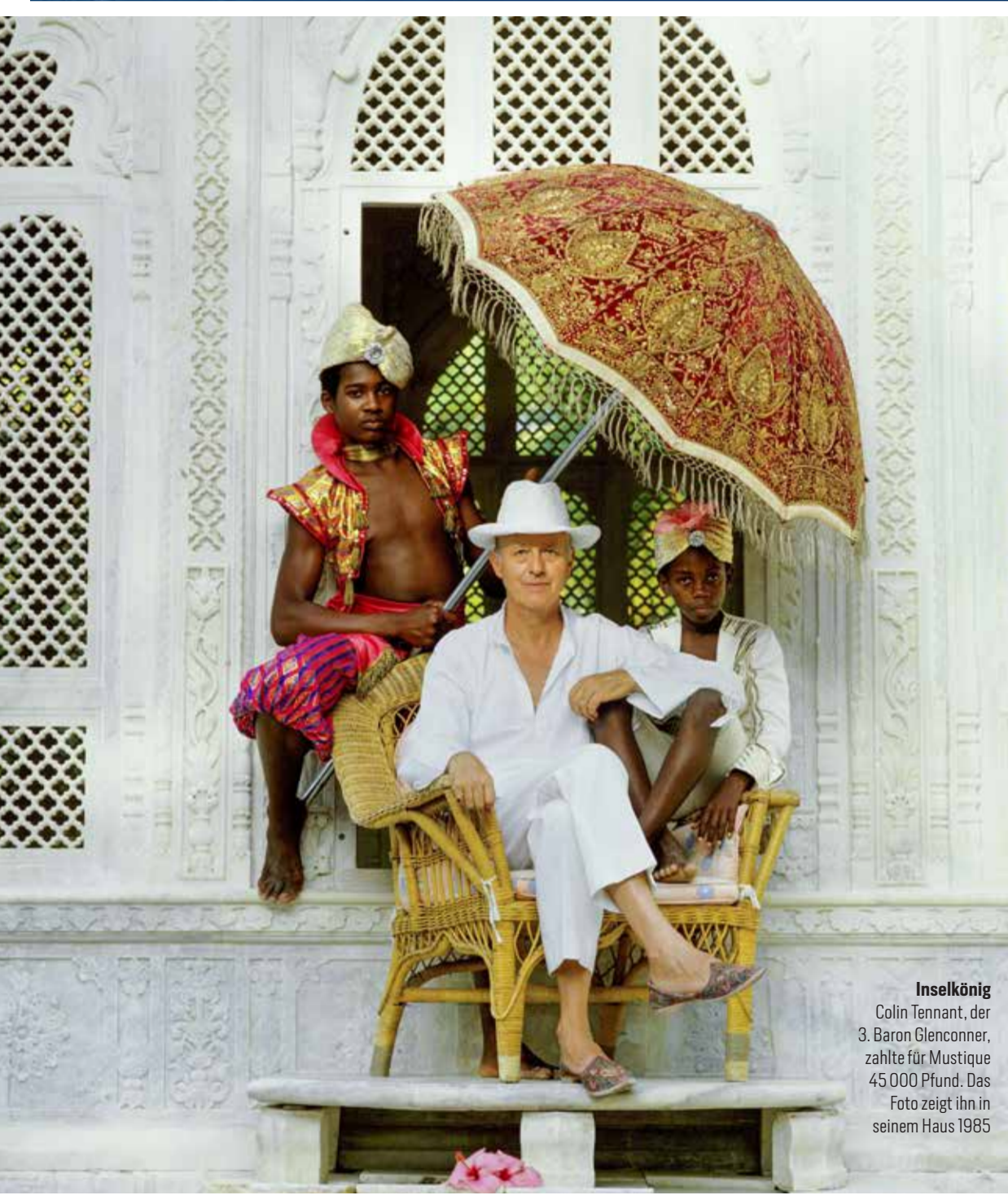
Inselkönig Colin Tennant, der 3. Baron Glenconner, zahlte für Mustique 45.000 Pfund. Das Foto zeigt ihn in seinem Haus 1985